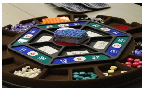
（ 戦略MGマネジメントゲーム盤 ）