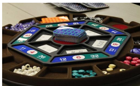
（ 戦略MGマネジメントゲーム盤 ）